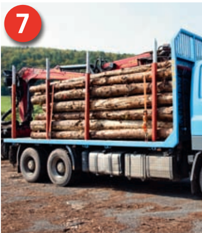
7 Das Fahrzeug ist ordnungsgemäß nach Lastverteilungsplan beladen und die Ladung ist ausreichend gesichert. Das Fahrzeug ist abfahrbereit.