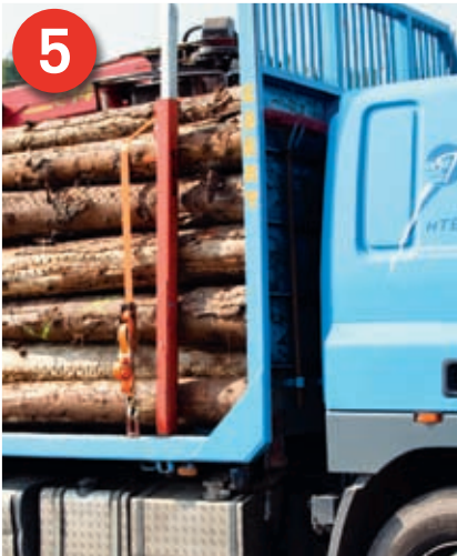
5 Zwei Niederzurrungen (siehe Bild 7) sichern die Stämme gegen Verrutschen untereinander und stabilisieren die ballige Verladung.