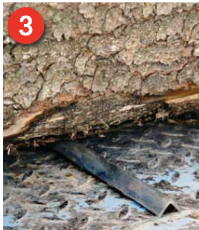
3 Keilleiste: Die unterste Lage des Rundholzes wird durch Keilleisten festgehalten. Alternativen sind Zahn- oder Stegleisten.