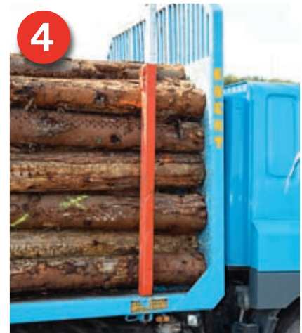
4 Formschlüssige Beladung: Die Ladung liegt in Fahrtrichtung an der ausreichend stabilen Stirnwand an.