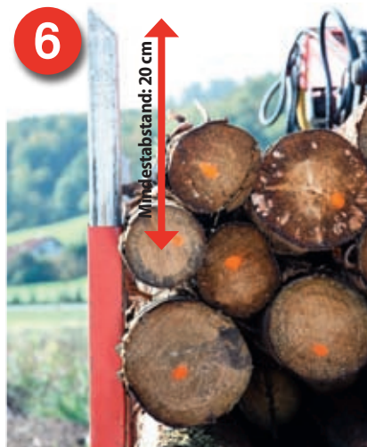
6 Verdichtung: Die Rungen müssen mindestens 20 Zentimeter über dem Mittelpunkt des obersten an der Runge anliegenden Stammes überstehen.