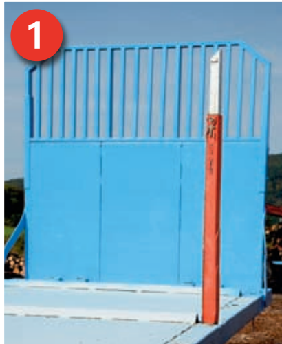
1 Geeignetes Fahrzeug (Beispiel) mit besenreiner Ladefläche, Keilleisten, Steckungen und einer ausreichend dimensionierten Stirnwand.