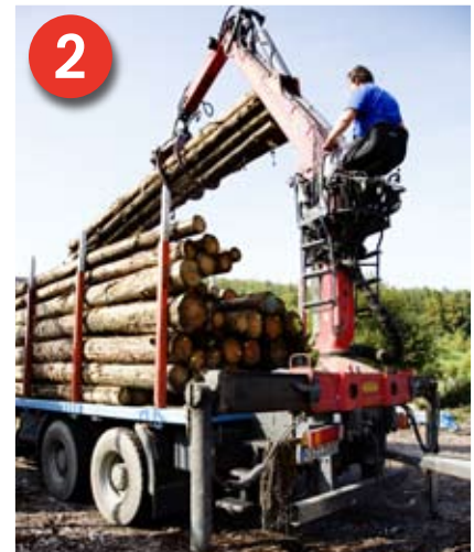
2 Ladegut: Beladung von Rundholz länger als 4 Meter. Die Beladung wird jeweils von außen nach innen vorgenommen.