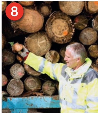
8 Bei kürzeren Stämmen unter 4 Meter keine Kavemen entstehen lassen. Darin lose liegende Stämme können aus dem Verbund rutschen.